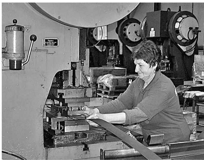
A költségsökkentés és a hatékonyság növelése a fő feladat

berek. A fémipar kvalifikált és elismert munkaterületeiről van szó, fiatal szakemberek azonban mégsem kerülnek ki az iskolákból. A cégek ennek megfelelően mindent megtesznek azért, hogy a munkájukat alapvetően meghatározó szerszámkészítő szakembereket alkalmazni tudják, illetve megtartsák.