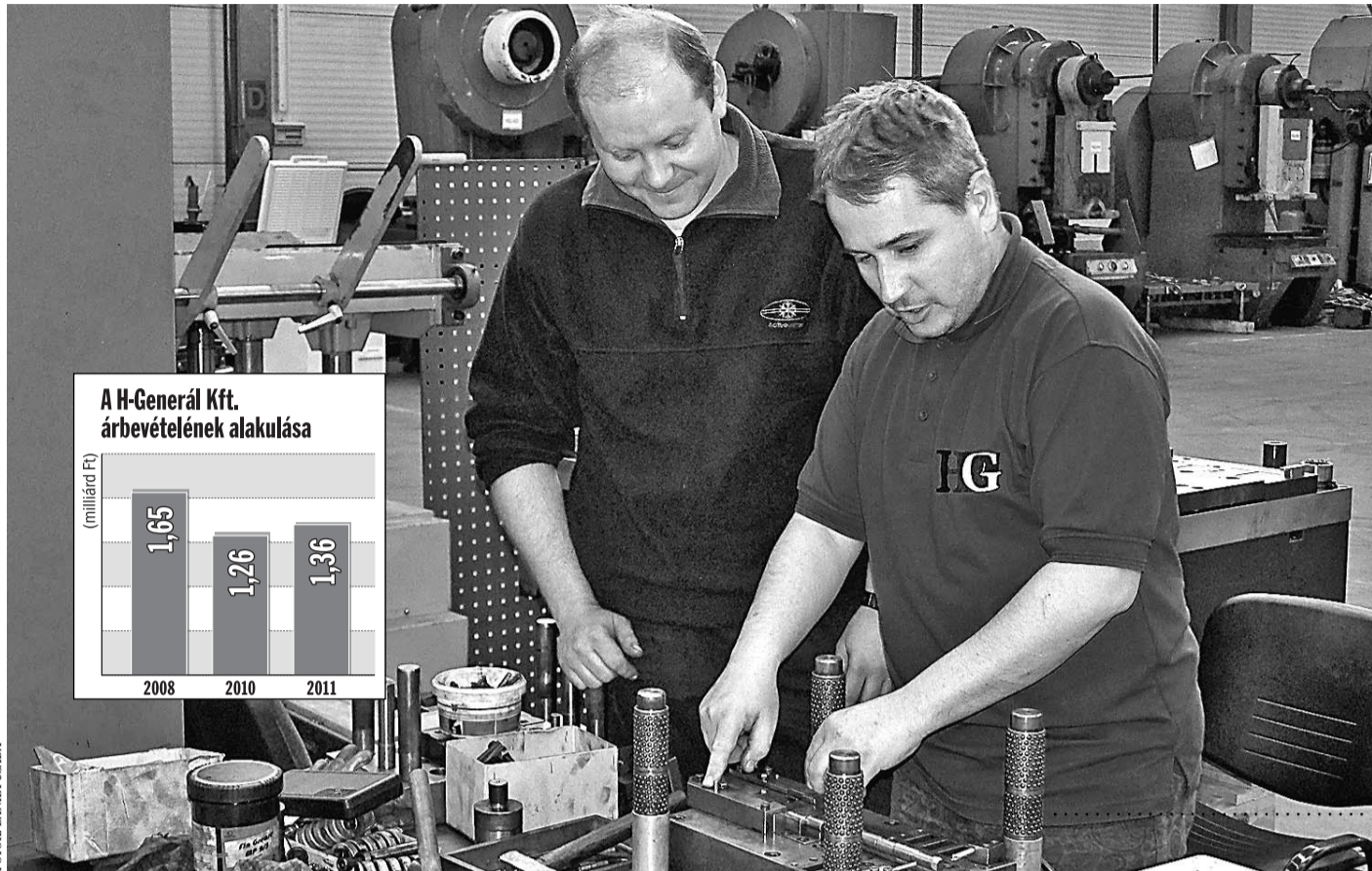
Nyugat-európai országokba is rendszeresen szállít precízen megmunkált fémalkatrészeket a jászberényi vállalkozás

– A cég indulásakor nem volt gond, hogy hogyan tud munkát szerezni a vállalkozás. Szinte csak az árajánlatokat kellett elkészíteni. Jelentős volt a fejlődés például 1992 és '95 között, 1995-ben sikerült a fővárosban is te-